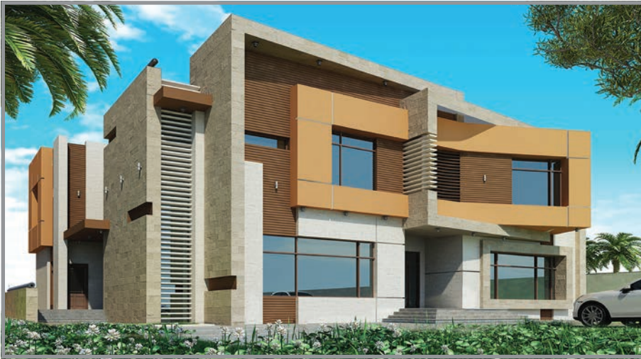
المنظور الأمامي للواجهة رقم 2