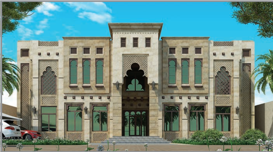
المنظور الأمامي للواجهة رقم 3