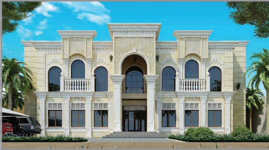
المنظور الأمامي للواجهة رقم 1