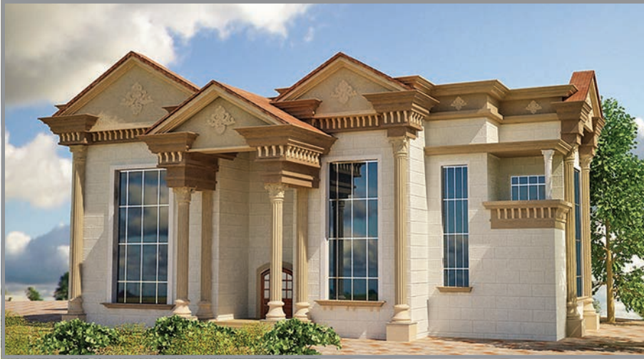
المنظور الأمامي للواجهة رقم 1