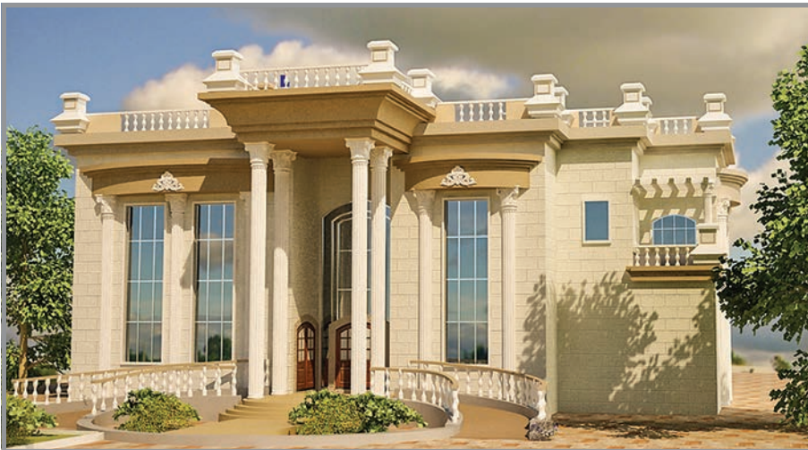
المنظور الأمامي للواجهة رقم 3