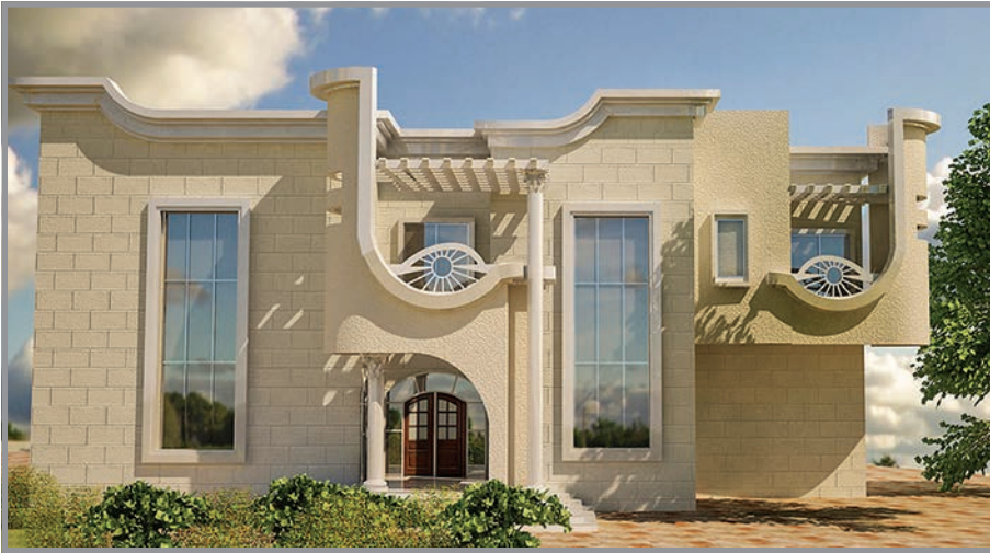
المنظور الأمامي للواجهة رقم 2