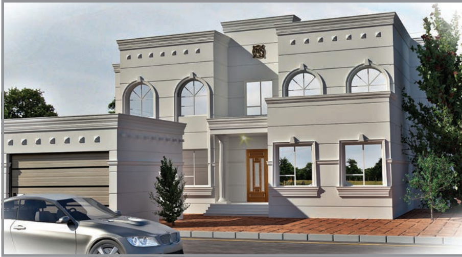
المنظور الأمامي للواجهة رقم 1