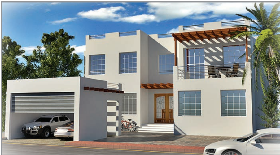
المنظور الأمامي للواجهة رقم 3