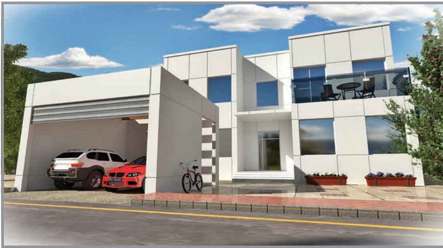
المنظور الأمامي للواجهة رقم 2