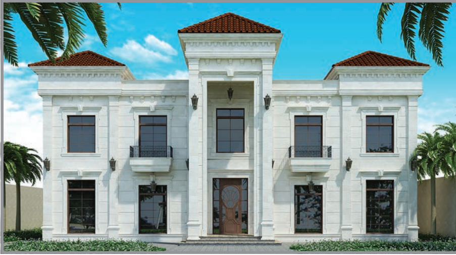
المنظور الأمامي للواجهة رقم 1