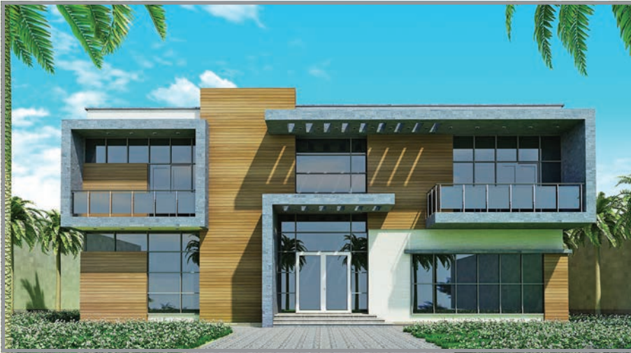
المنظور الأمامي للواجهة رقم 2