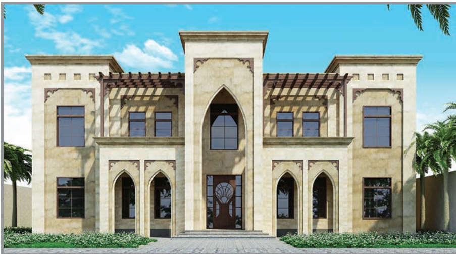
المنظور الأمامي للواجهة رقم 3