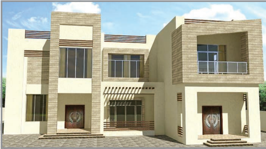
المنظور الأمامي للواجهة رقم 2