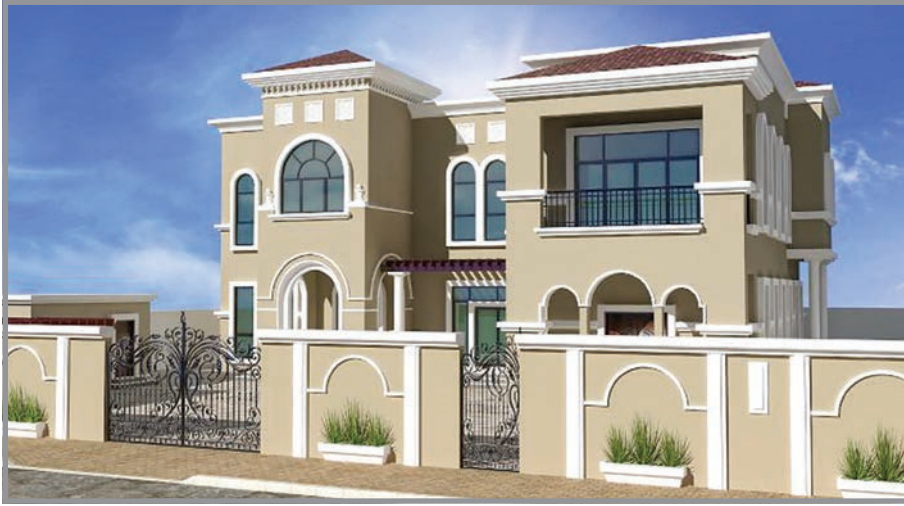
المنظور الأمامي للواجهة رقم 1