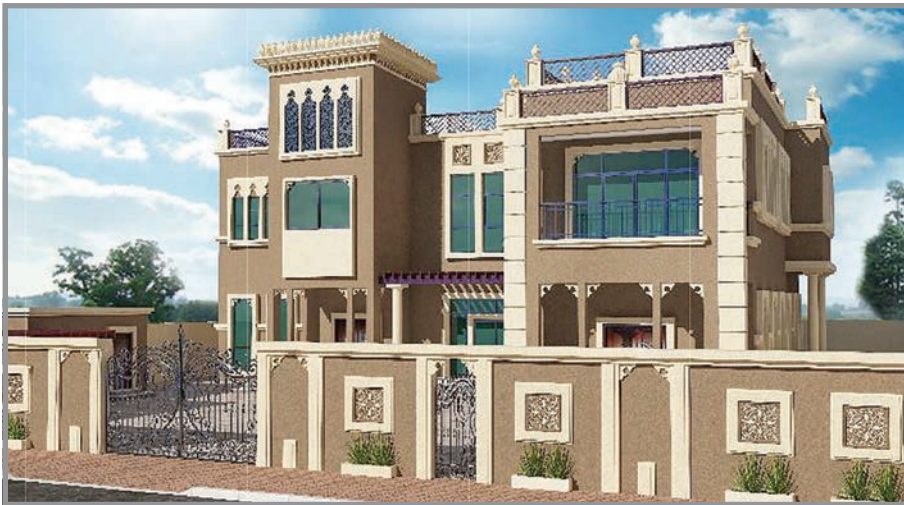
المنظور الأمامي للواجهة رقم 3