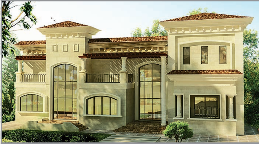
المنظور الأمامي للواجهة رقم 1