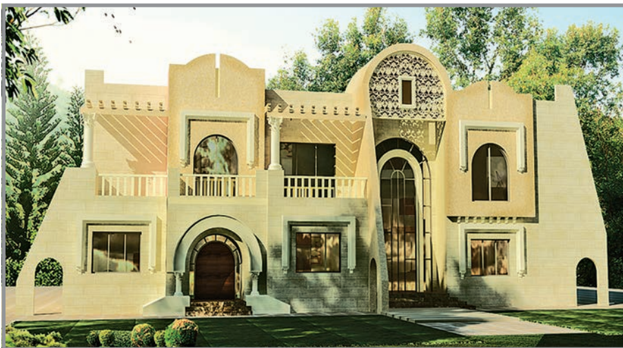
المنظور الأمامي للواجهة رقم 3