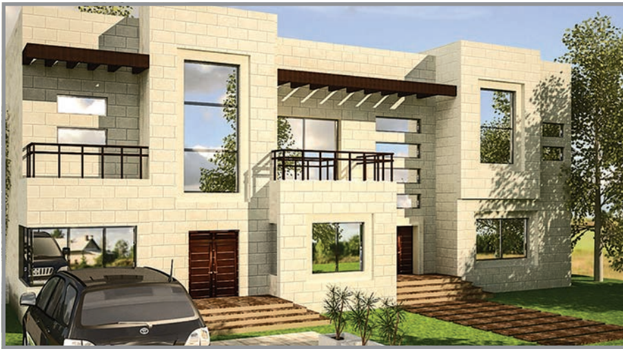
المنظور الأمامي للواجهة رقم 2