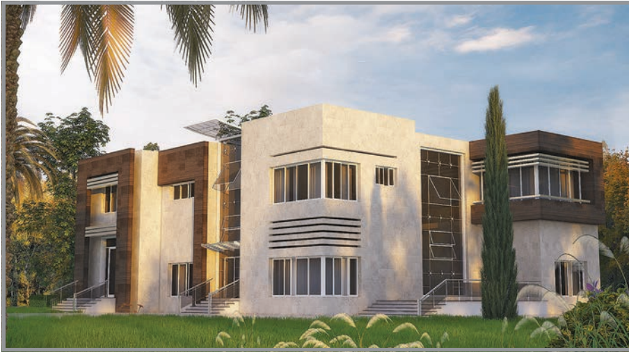
المنظور الأمامي للواجهة رقم 2