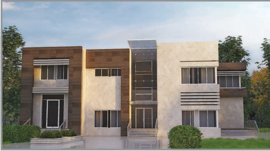
المنظور الأمامي للواجهة رقم 1