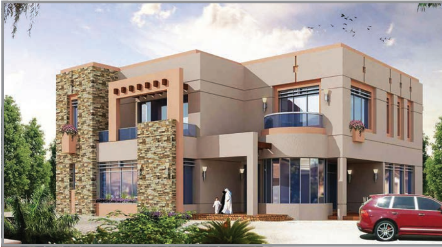
المنظور الأمامي للواجهة رقم 2