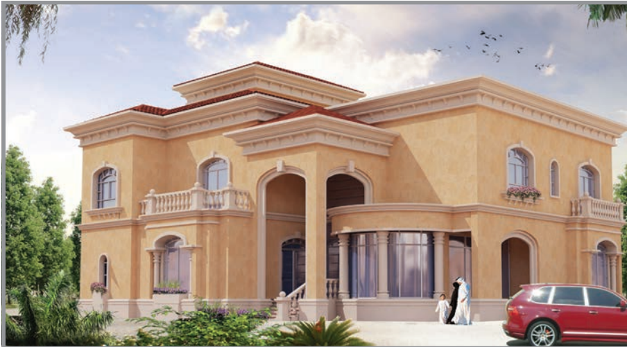
المنظور الأمامي للواجهة رقم 3