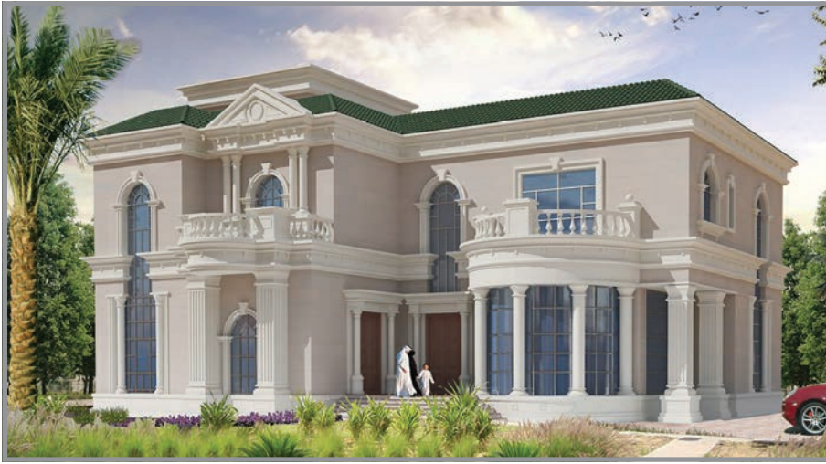
المنظور الأمامي للواجهة رقم 1