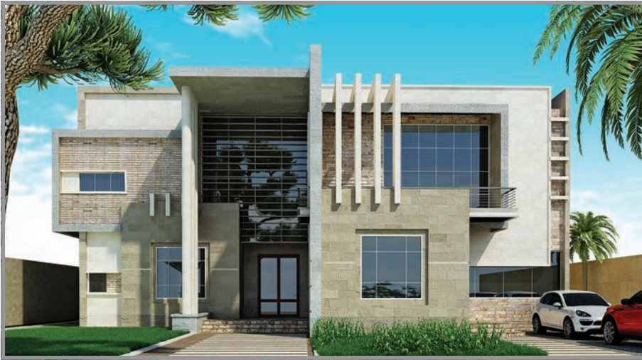
المنظور الأمامي للواجهة رقم 2