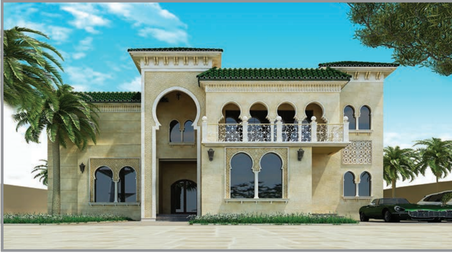
المنظور الأمامي للواجهة رقم 1