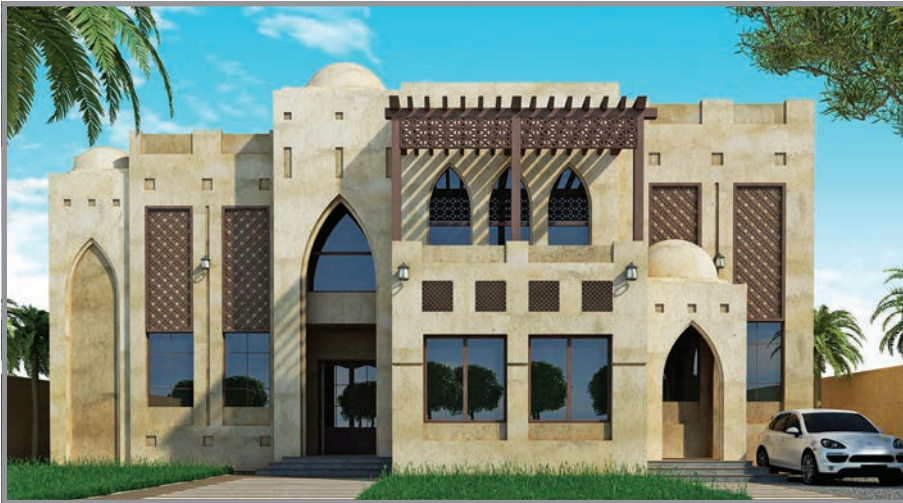
المنظور الأمامي للواجهة رقم 3