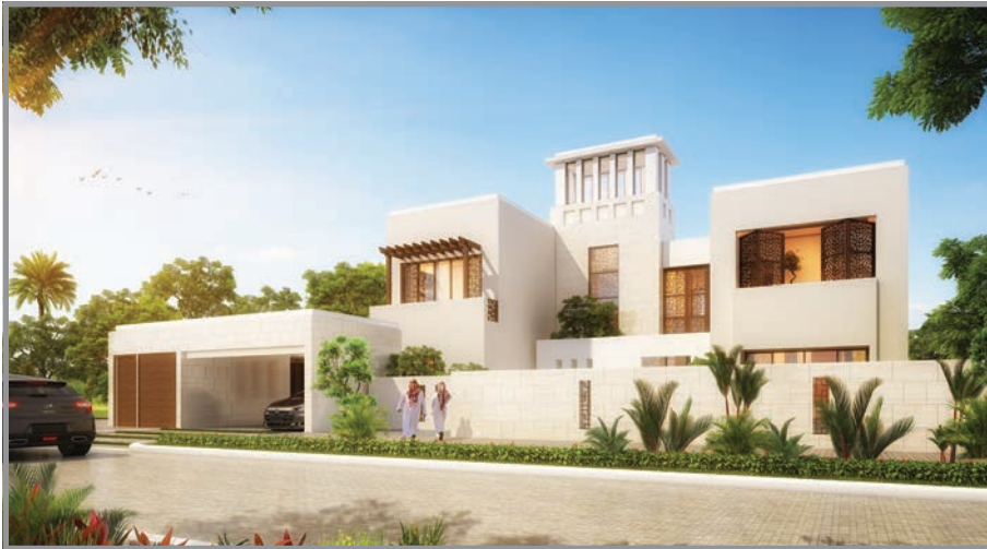
المنظور الأمامي للواجهة رقم 3