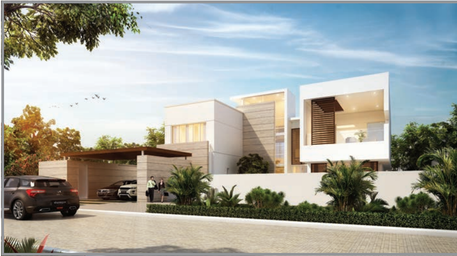
المنظور الأمامي للواجهة رقم 2