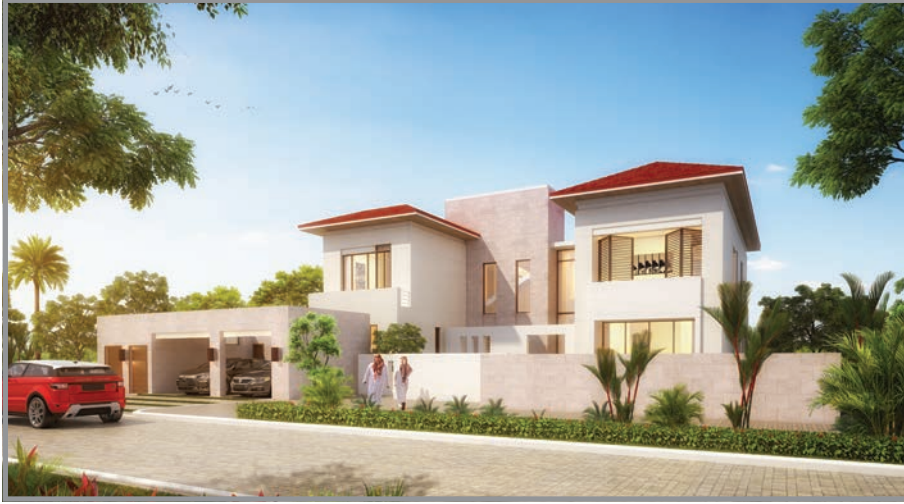
المنظور الأمامي للواجهة رقم 1