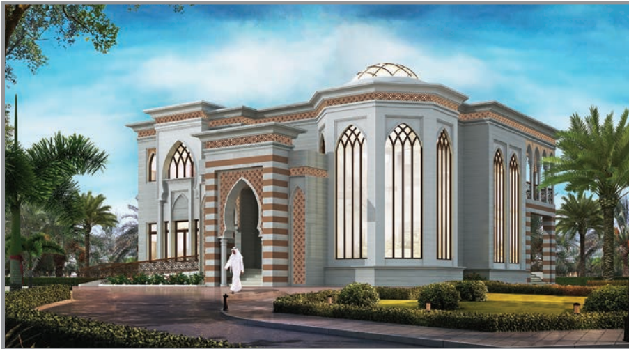
المنظور الأمامي للواجهة رقم 3