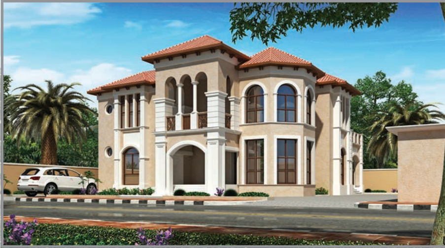
المنظور الأمامي للواجهة رقم 1