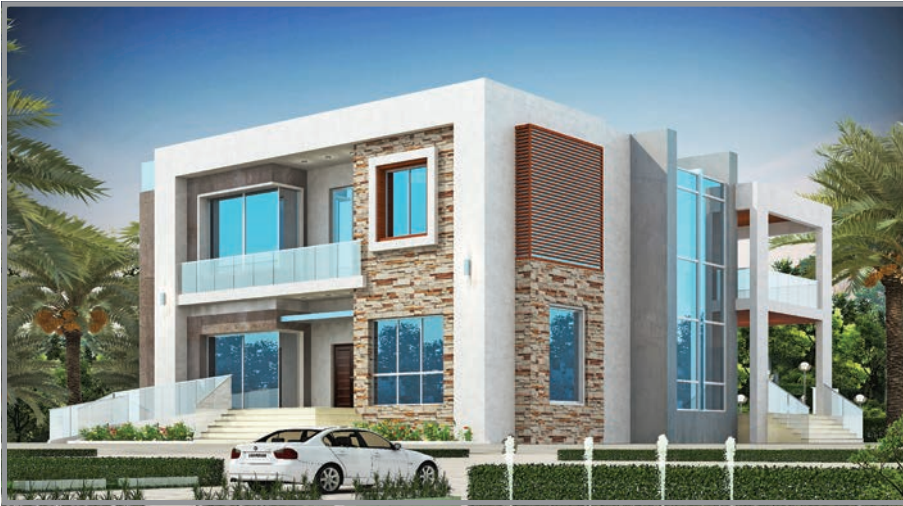
المنظور الأمامي للواجهة رقم 2