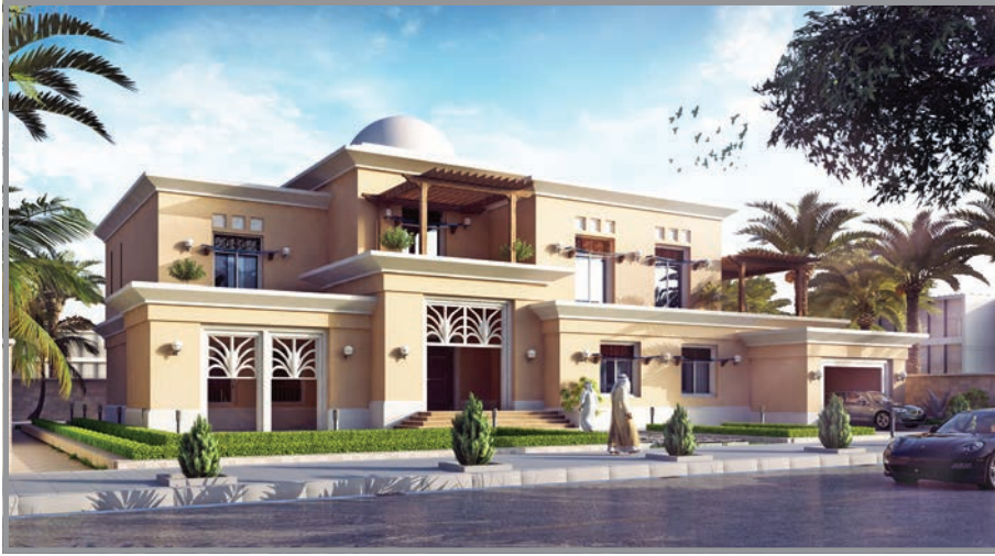
المنظور الأمامي للواجهة رقم 1