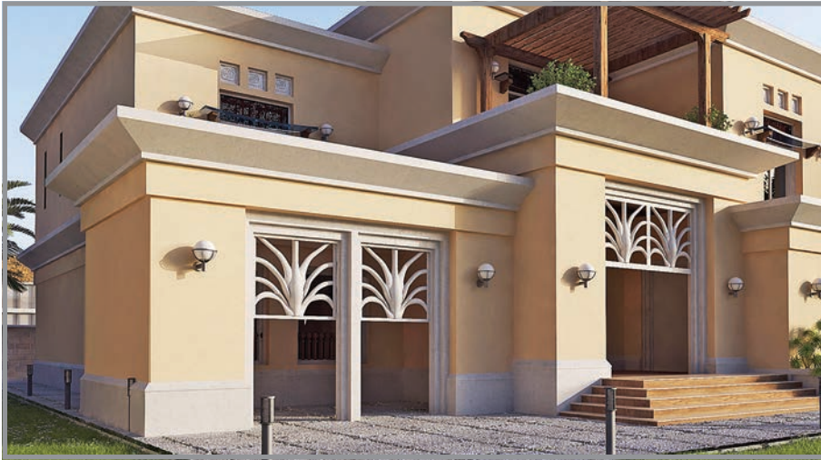
المنظور الأمامي للواجهة رقم 1