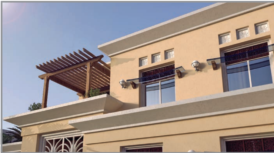
المنظور الأمامي للواجهة رقم 1