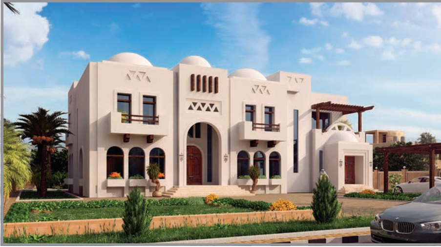
المنظور الأمامي للواجهة رقم 1