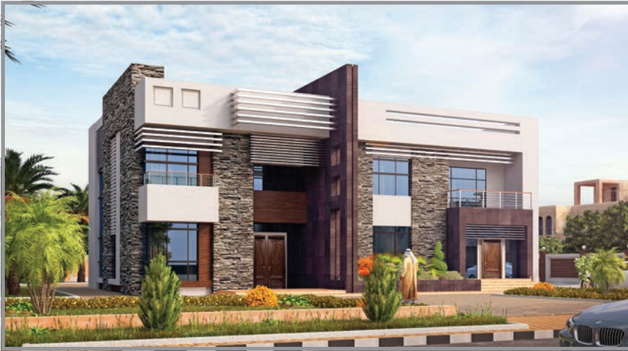
المنظور الأمامي للواجهة رقم 2