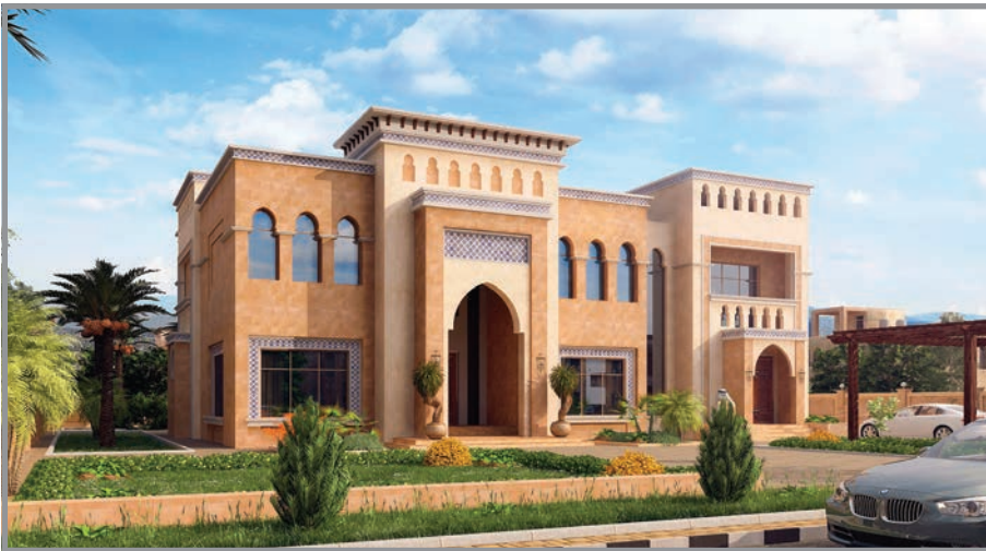
المنظور الأمامي للواجهة رقم 3